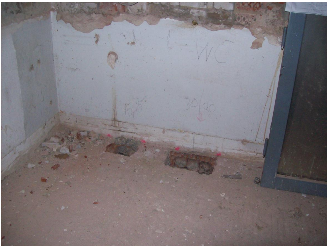
Hier wurden schon die Rohre für die Toilette verlegt.