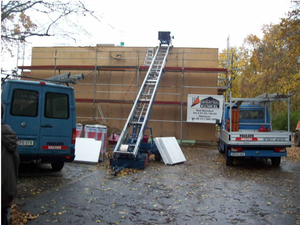
Die Autos von den verschiedenen Arbeitern.